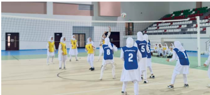
صورة أرشيفية من مباريات البطولة

غد الاثنين، بينما الختام ومباراة تحديد المركزين الثالث والرابع سوف صباح الثلاثاء. الجدير بالذكر بأن بعض المديرية التعليمية