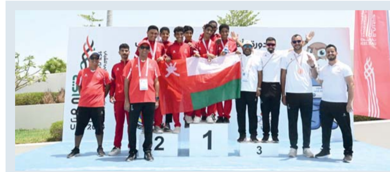
منتخب الدراجات ينهي مشاركته

كان لغرض المنافسة من خلال انتقاء الألعاب الرياضية التي لها الفرصة الأكبر بالتتويج، وأيضا هي فرصة لمنتخبنا المشاركة في الألعاب الرياضية للاحتكاك ومحطة إعدادية جيدة لهذه الفئات السنية للاستحقاقات القادمة» «المنتخبات الوطنية التي تواجدها في هذه الدورة كان من المقترض أن تحصد ميداليات أكثر وهذا الهدف الأسمى من تواجدها وإثبات وجودها بالصعود إلى منصات التتويج، الأغلبية منها استطاعت أن تصل إلى منصات التتويج، وستتضح الصورة أكثر خلال باقي الأيام من خلال عدد الميداليات الإجمالية التي حصلت عليها المنتخبات الوطنية» «نحن فريق متواجد في دولة الإمارات العربية المتحدة بعيدا عن النتائج هناك بعض الملاحظات على منتخبنا المشاركة، والتي تحتاج فيها للجولس مع اللجان الرياضية، والمنتخبات عليها أن تتجاوز الملاحظات لكي ترفع فرص اختيارها للمشاركة الخارجية القادمة» «نشكر اللجنة المنظمة وكل من تعاون وساعدنا، ونحن أبناء دول مجلس التعاون مكملين لبعض ونغطي كل الهفوات إن تواجدها، في الحقيقة لم يكن هناك أي تقصير من اللجنة المنظمة والمساعدين والمتطوعين ووسائل الإعلام، ولا يفوتنا أن نشكر زملائنا أعضاء البعثة العمانية الذين تواجدها خصوصا في الأيام الأولى، حيث سهلوا بما استطاعوا في سبيل راحة منتخبنا الوطنية وأيضا الفريق الإعلامي المتواجد الذي حضر كل المباريات وكل الملاعب، وحفل الافتتاح ونقل صورة واضحة عن البطولة.»