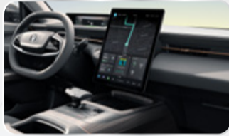
شاشة وسطية ١٣.٢ بوصة