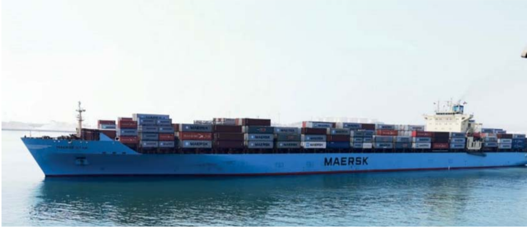
قطاع الشؤون البحرية يعد أحد القطاعات الرئيسية الواعدة ضمن المنظومة اللوجستية

مسقط. العمانية: يعد قطاع الشؤون البحرية أحد القطاعات الرئيسية الواعدة ضمن المنظومة اللوجستية، ويسهم بشكل جذري في تنوع مصادر الدخل وإيجاد فرص استثمارية متنوعة وفرص وظيفية. حيث أن إجمالي الإيرادات التي حققها قطاع الشؤون البحرية في عام 2023م بلغ مليوناً و122 ألف ريال عماني.