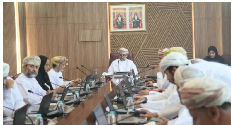
■ الاجتماع ناقش مشروع سوق الأسماك بولاية مسيرة

الامتياز (52) بولاية مسيرة ومشروع المسح الجيوفيزيائي بالمحافظة، ومشروع مزلاق الصيادين بمنطقة الحجر برأس الحد، وفيما يخص الشأن الإسكاني فقد تم مناقشة موضوع المنازل وقطع الأراضي المتأثرة بمخطط النهضة ووادي دفيات وإعادة تخطيط وتسكين مخطط دوة وعجبت بولاية مسيرة. كما اعتمد المجلس مسميات الشوارع والفري والتجمعات السكنية بولايات المحافظة. إلى جانب ذلك، اطع المجلس على طلبات أعضاء المجلس لتنمية وتطوير ولايات المحافظة وتوصيات لجنة الشؤون الصحية والبيئية والتصديق على محضر اجتماع المجلس الثالث وما تضمنه من توصيات.