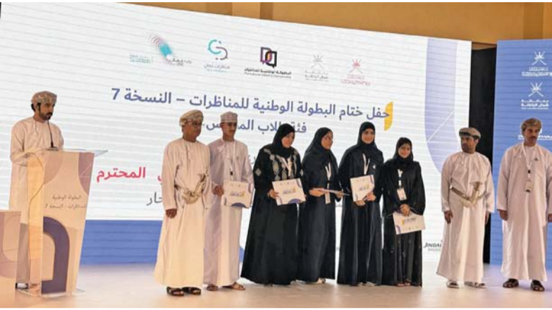
■ أثناء تكريم الطلبة الفائزين

بالبطولة والذي جاء بعد مراحل من الإعداد والتجهيز والتدريب للفريق للمشاركة في هذه البطولة. وأوضحت بأن فن المناظرات الطلابية غرس ثقافة الحوار بما يتناسب مع فلسفة البطولة وأهدافها وأنها ذات أهمية بالغة ووسيلة تعليمية مهمة وفاعلة لتحليل القضايا والأفكار وتسهيل الضوء عليها من خلال مناقشتها بأسلوب الحوار العلمي الراقى والمتحضر مع تلميحها للمهارات الإقناع لديهم وتقبلهم للرأي والرأي الآخر، مؤكدة أن البطولة الوطنية السابعة للمناظرات عززت أواصر التواصل والترابط بين الطلبة المشاركين من مختلف محافظات سلطنة عمان. وأشارت إلى أنه تم تدريب الطلبة المشاركين على فن المناظرات الطلابية وتهيئتهم للمشاركة على كافة المستويات المختلفة وتوعيتهم بالقضايا العامة وزيادة إلمامهم بها، إضافة لتمكينهم في كيفية تنمية مهارات التفكير والفهم واستنباط الحقائق لديهم وإذكاء روح البحث بينهم، ودفعهم لتحصيل المعارف المختلفة وتنمية مهارات التحليل والنقد واستخلاص الأفكار الرئيسية والخطابة والطلاقة اللفظية والقدرة على الارتجال لديهم والتعبير عن آرائهم واحترام الآخرين.