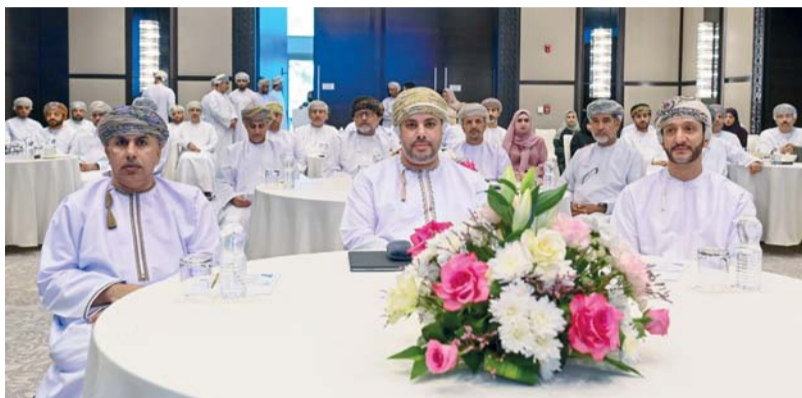
الحضور أثناء اللقاء التشاوري بشأن تطوير القطاع الصحي

وكيل وزارة الخارجية للشؤون الدبلوماسية يلتقي بمسؤولين أميركيين الأكاديمية السلطانية للإدارة تحتفل بتخريج ٢٤ مدرياً