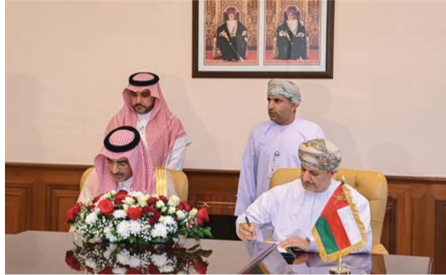
المذكرة تهدف إلى تطوير القطاعات الصناعية واللوجستية

خلال الفترة (٢٣ - ٢٥ أبريل ٢٠٢٤). وحظيت منتجاتها بإشادة واسعة النطاق لالتزامها بالاستدامة والتميز، وبرزت منتجات شركة تنمية أسماك عمان من بين أكثر من ٢٠٠٠ مشارك أوروبي وعالمي، واستقبلت القاعة التي يوجد فيها جناح المجموعة بالمعرض أكثر من ٣٥٠٠٠ زائر، يتفوقون لاستكشاف الشراكات مع المؤسسة المتخصصة في الممارسات المسؤولة. وشهد جناح الشركة في المعرض، الذي لاقي إقبالا كبيرا حيث سلط الضوء بشكل بارز على مجموعة من منتجاتها المتنوعة، بما في ذلك عمليات صيد الأسماك ذات المستوى العالمي، ومنتجات تربية الأحياء المائية، لتكون واحدة من أكبر شركات التعليب والمعالجة في الشرق الأوسط.