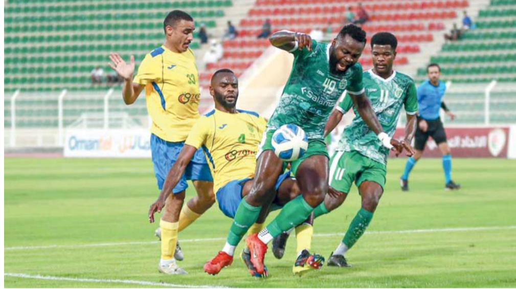
صورة أرشيفية من مباريات دوري عمانتل

الموسم ودخلا في دائرة الخطر من السقوط للدرجة الأولى التي لا ترحم التاريخ. ظفار يدخل المباراة وهو في المركز التاسع برصيد (٢٠) نقطة وهو العائد من خسارة جديدة في الجولة الماضية أمام عبري بهدف نظيف وهي الخسارة التي ضربت الزعيم في مقتل وبات يعاني الامرين في هذا الموسم على غير العادة، فيما النصر الذي يحتل المركز الثامن برصيد (٢٢) نقطة ليس بأفضل حالا من منافسه التقليدي فهو ضمن دائرة الخطر كذلك، وبعقباتي ان فوز طرف على الآخر سيجنبه ويلات صراع الهبوط تماما، فيما الخسارة ستكون نتائجها وخيمة للغاية، فيما التعادل سيبقي الحال كما هو عليه حتى اشعار آخر خاصة اذا تمكن صور من الفوز في لقاء اليوم.