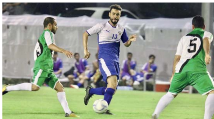
من مباريات دوري المركز الرياضي بولاية العوابي

العوابي. من حمود الخروصي: أقيمت ضمن منافسات الأسبوع الثاني لدوري المركز الرياضي بولاية العوابي بمحافظة جنوب الباطنة التابع لوزارة الثقافة والرياضة والشباب مباراتان في انطلق الأسبوع الثاني من