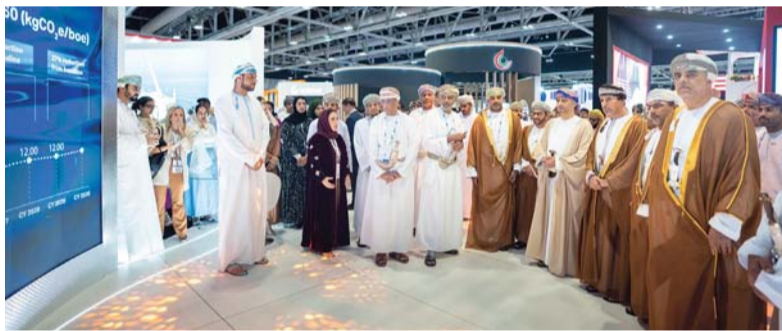
أوكيو سلطت الضوء على محفظة المشاريع المشتركة للمجموعة

الجناح ممارساتها المستدامة بما في ذلك الجهود المختلفة الهادفة إلى تحييد الكربون، وتسليط الضوء على محفظة المشاريع المشتركة للمجموعة التي تدعم مشاريعها المختلفة، بما في ذلك تطوير الغاز. فضلا على التعريف بشركائها والمستثمرين.