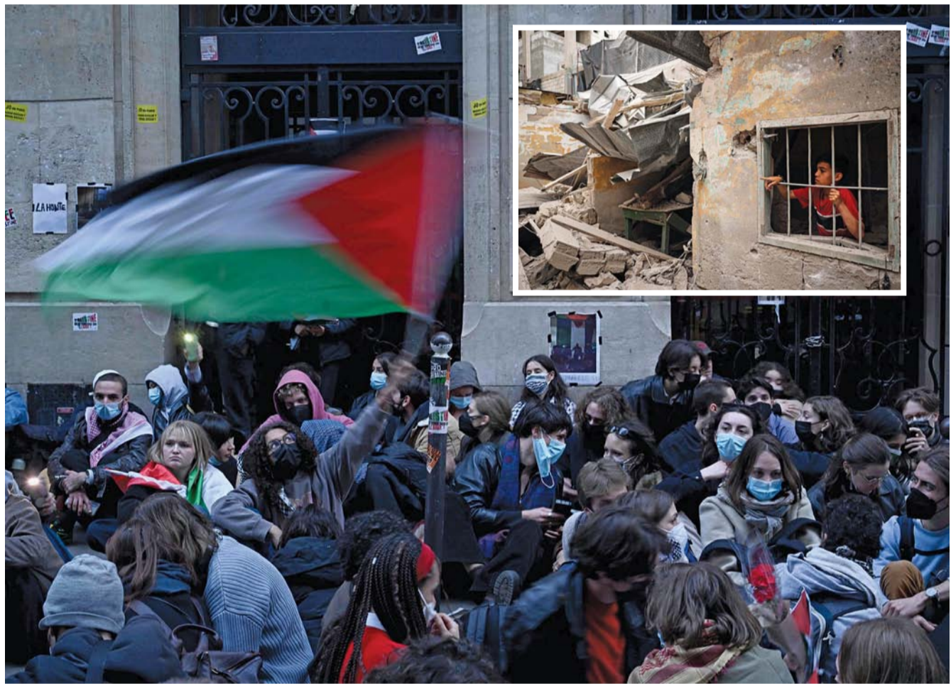
■ متظاهر يلوغ بالعلم الفلسطيني أثناء اعتصام أمام شرطة مكافحة الشغب الفرنسية بالقرب من مدخل مبنى معهد الدراسات السياسي الذي يحتله الطلاب، في باريس. وفي الإطار طفل فلسطيني يقف وسط أنقاض منزل دمره القصف الإسرائيلي ليلاً في رفح بجنوب قطاع غزة.

القسم المحتلة. «الوطن» وكالات: أعلنت وزارة الصحة الفلسطينية بغزة أن الاحتلال الإسرائيلي ارتكب 4 مجازر ضد العائلات وصل منها للمستشفيات 32 شهيداً و 69 مصاباً خلال 24 ساعة، حيث يواصل الاحتلال قصف مختلف مناطق القطاع. وأشارت الصحة إلى ارتفاع حصيلة العدوان الإسرائيلي إلى 3438 شهيداً و 77437 مصاباً منذ السابع من أكتوبر الماضي. وأهابت بذوي الشهداء ومفقودي الحرب على غزة ضرورة استكمال بياناتهم بالتسجيل عبر الرابط المرفق، لاستيفاء جميع البيانات عبر سجلات وزارة الصحة. وأشارت الصحة إلى أن عدد الشهداء في الضفة منذ حرب غزة بلغت، 491 شهيداً، بينهم 123 طفلاً، و 5 نساء، و 5 مسنين، و 10 شهداء من الأسرى داخل سجون الاحتلال. وواصلت الطائرات الإسرائيلية قصفها لمختلف مناطق قطاع غزة في اليوم 204 من الحرب مختلفة العشرات من الشهداء والجرحى. من جانبه أكد مسؤول أميركي بارز أن إسرائيل دمرت خان يونس بحثاً عن قادة حماس ولم تجدهم. ونقلت صحيفة «نيويورك تايمز» عن المسؤول الأميركي «نقول لإسرائيل إن هناك طريقة أكثر دقة لملاحقة قادة حركة المقاومة الإسلامية (حماس) غير تدمير رفح جزءاً بعد الأخر. من جانب آخر أعلنت حركة حماس في بيان أنها تسلمت الرد الإسرائيلي الرسمي على موقف الحركة الذي سلمته إلى الوسطاء المصريين والقطريين