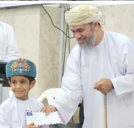
أثناء تكريم الفائزين في المسابقة

وفي الختام قام راعي المناسبة بتكريم الفائزين بالمسابقة وكذلك أعضاء لجنة التحكيم والقائمين على المسابقة والداعمين، كما قدمت هدية تذكارية لراعي المناسبة. يذكر أنّ المسابقة تتضمن سبعة مستويات،