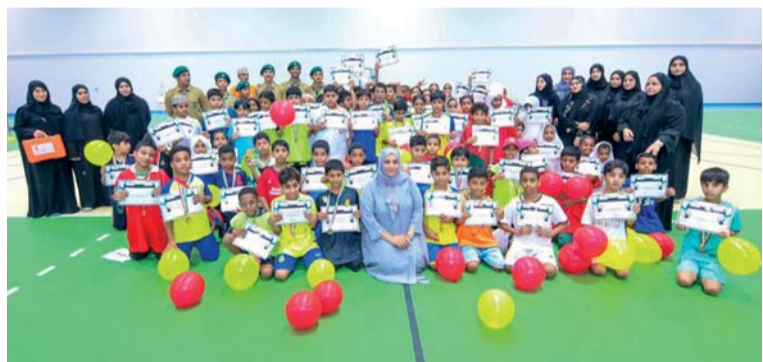
صورة جماعية للمشاركين في المهرجان

الرساق. من سيف الغافري: اختتمت بمحافظة جنوب الباطنة فعاليات مهرجان ألعاب القوى للطلبة الصغار الذي نظمته وحدة الرياضة المدرسية بتعليمية جنوب الباطنة بالتعاون مع اتحاد ألعاب القوى على مدار خمسة أيام بمشاركة عدد من مدارس المحافظة.