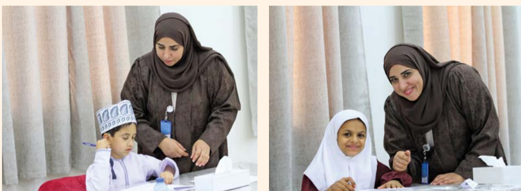
تطوير إمكانيات وقدرات ذوي الإعاقة السمعية

اختتمت بالمديرية العامة للتربية والتعليم بمحافظة جنوب الباطنة التصفيات النهائية لمسابقة حفظ القرآن الكريم لذوي الإعاقة السمعية التي نظمتها وزارة التربية والتعليم بالتعاون مع دائرة التربية الخاصة والتعلم المستمر بتعليمية جنوب الباطنة، تضمنت المسابقة ثلاثة