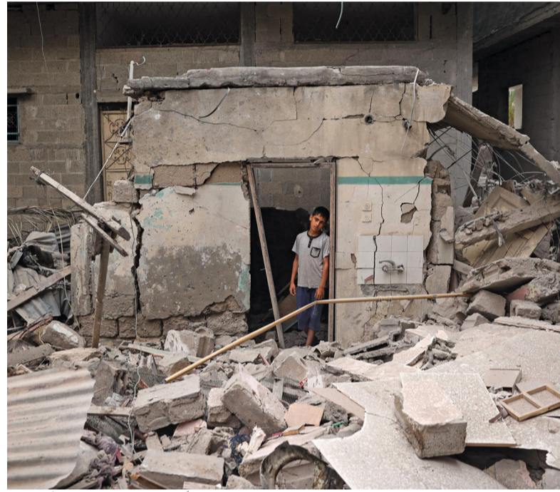
■ طفل فلسطيني يقف وسط أنقاض منزل دُمّرهُ القصف الإسرائيلي ليلاً في رفح بجنوب قطاع غزة، ١٠ آب.

مسقط. العُمانية: شهد الرقم القياسي العام لأسعار الواردات في سلطنة عُمان بنهاية الربع الرابع من عام ٢٠٢٣م استقراراً مقارنة بالربع المماثل من عام ٢٠٢٢م، حيث بينت الإحصاءات الصادرة عن المركز الوطني للإحصاء والمعلومات أن أسعار مجموعة المصنوعات المتنوعة ارتفعت بنهاية الربع الرابع من العام الماضي بنسبة (١٢,٦) بالمائة والمكينات ومعدات النقل ب(٦,٥) بالمائة، ومجموعة المواد الخام غير الصالحة للأكل باستثناء الوقود ب(٤,٥) بالمائة ومجموعة المشروبات والتبغ ب(٢,٨) بالمائة.