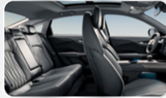
مقاعد بتصميم رياضي