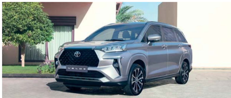
تويوتا فيلوز الجديدة تقدم تجربة قيادة ديناميكية

كفاءة ممتازة في استهلاك الوقود مع السرعات الأعلى. كما تأتي السيارة الجديدة مع مجموعة من الميزات المقدمة والعلوية وتشمل هذه المزايا منها، شاشة ملونة تعرض المعلومات المتعددة مقاس ٧ بوصات في وسط لوحة العدادات، تكملها شاشة وسائط متعددة مقاس ٨ بوصات مزودة بنظام أبل كار بلاي، أندرويد أوتو لرحلات متصلة بسلاسة. يمكن أن تستوعب صفوف المقاعد الثلاثة في تويوتا فيلوز الجديدة ما يصل إلى سبعة أشخاص، إذ يمكن طي الصفين الثاني والثالث معا أو بشكل فردي للحصول على أنماط مختلفة يمكن أن تتيح المزيد من المساحة للركاب أو حمل المزيد من الأغراض، بما في ذلك الأشياء الطويلة.