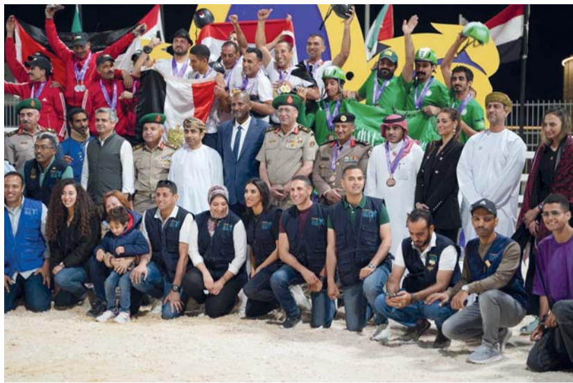
تتويج المنتخب الفائزة بالبطولة العسكرية