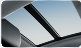
فتحة سقف بانورامية

BLUECORE استهلاك أقل للوقود Fuel Efficient Engine