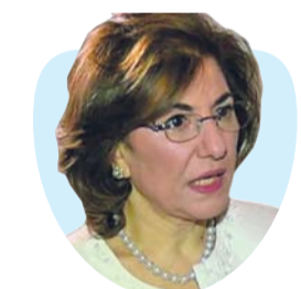
أ.د. بثينة شعبان كاتبة سورية

«إذ كانت هذه الجامعات التي يفخرون بها العالم قد أنجبت على مدى عقود النخب الحاكمة التي حكمت ووجهت بوصلة الحكم في الولايات المتحدة فلماذا سحب الثقة اليوم من هذه النخبة ذاتها وتوجيه الإهانة والإذلال والقمع...»