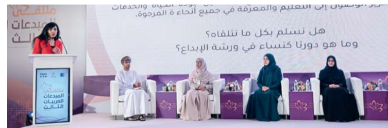
تعزيز التفكير الإبداعي في التقنيات الرقمية والدكاء الاصطناعي