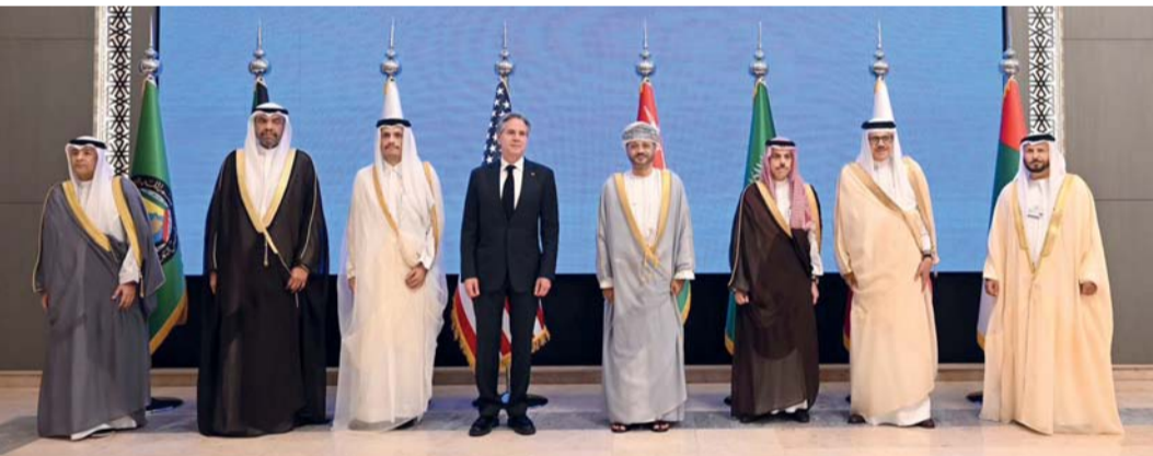
صورة جماعية لوزراء خارجية دول المجلس التعاون مع وزير الخارجية الأمريكي

الرياض - العُمانية: شاركت سلطنة عُمان في الاجتماع الوزاري المشترك بين وزراء خارجية دول مجلس التعاون لدول الخليج العربية ومعالي انتوني بلينكن وزير خارجية الولايات المتحدة الأمريكية الذي عقد أمس بمقر الأمانة العامة لمجلس التعاون في العاصمة السعودية الرياض وبمشاركة أصحاب السمو والمعالي وزراء خارجية دول مجلس التعاون لدول الخليج العربية ومعالي الأمين العام لمجلس التعاون وترأس