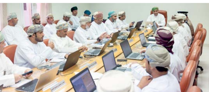
أثناء اجتماع أعضاء المجلس البلدي بشمال الباطنة

يجب الاستفادة القصوى من الأحداث والتجارب والقصص التي حدثت أثناء هذه الأنواء الخرج منها بدروس مفيدة وتجارب مثيرة تسهم في رفع جودة الأعمال مستقبلاً. بعد ذلك صادق المجلس على محضر الاجتماع السابق وما تضمنه من توصيات بشأن عدد من المواضيع. تم خلال الاجتماع استضافة المختصين من هيئة تنظيم الاتصالات للوقوف على أسباب انقطاع شبكة الاتصالات أثناء الحالات الطارئة، لا سيما في