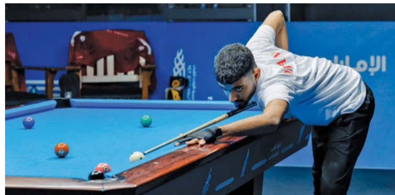
لاعب منتخبنا خلال مشاركته في منافسات البلياردو

بلغ عدد الميداليات الملونة التي حصدتها منتخبنا الوطنية بعد اليوم الثالث عشر من البطولة ٤٤ ميدالية ملونة، تنوعت بين ١٤ ميدالية ذهبية، ١٠ ميداليات فضية، و١٩ ميدالية برونزية، حيث تشارك بعثة سلطنة عمان في هذه الدورة في ١٥ لعبة من أصل ٢٥ لعبة، هي الإبحار الشراعي، وكرة القدم، والجولف، والتايكواندو، والرياضات المائية، وألعاب القوى، وكرة اليد، وكرة الطائرة، وكرة السلة، والشطرنج، والمبارزة، وكرة الطاولة، والبلياردو والسنوكر، والفروسية بالإضافة إلى مشاركة اللجنة البارالمبية.