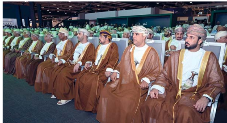
عقد على هامش المؤتمر لقاء استثنائي وخاص للمستثمرين

الجهات الرسمية أو جهات خاصة، وتأمل الجمعية العقارية أن تكون شريكاً حقيقياً وفعالاً عبر عدد من المبادرات، فهناك الكثير من الفرص التي يمكن أن تتكامل مع عمر ما هو مطروح حالياً. مثال على ذلك تتضح البيانات أن عدد العمانيين العاملين في الشركات العقارية لا يتجاوزون ٣٠٠٠ موظف بما يمثل نسبة متواضعة، وهي من القدرة الاستيعابية وهي ٢٠,٠٠٠ ألف موظف، وهذا ما يشكل تقريباً ١٤ بالمائة ويبعد عدداً قليلاً.