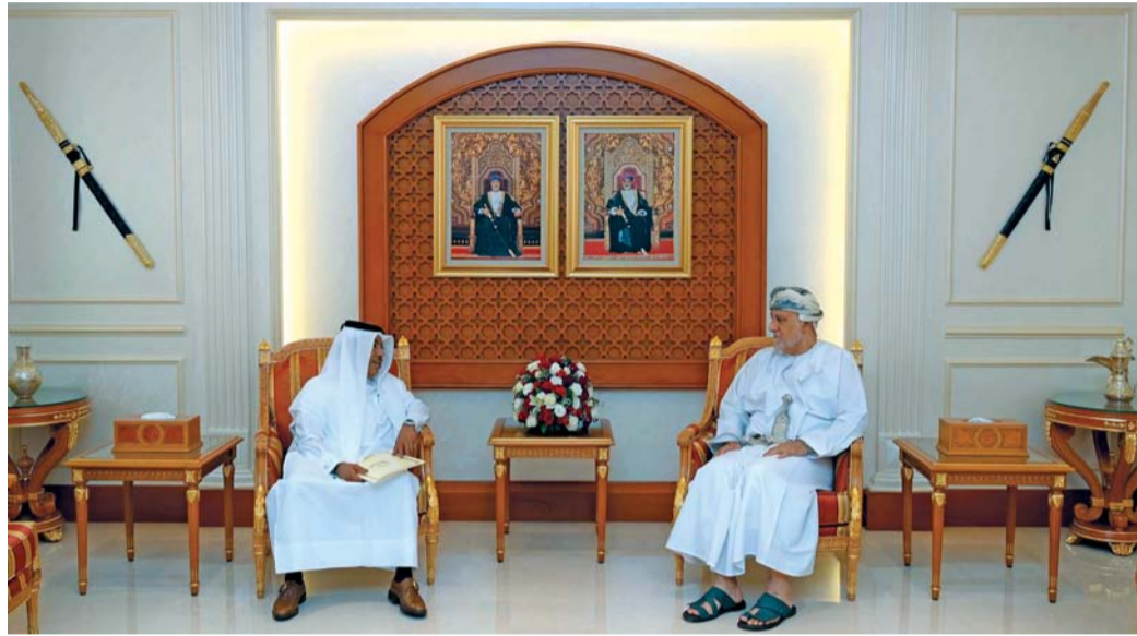
شهاب بن طارق لدى استقباله مبارك آل ثاني

المقابلة تبادل الأحاديث، واستعراض العلاقات الثنائية القائمة بين البلدين الشقيقين وسُبل تعزيزها، إلى جانب بحث عدد من الموضوعات ذات الاهتمام المشترك.