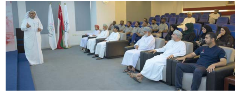
إحدى جلسات برنامج تدريب مدربي تعليم القيم الأولمبية

الإبحار الشراعي في سلطنة عمان، وستعمل على بناء شراكات استراتيجية مع المدارس والنوادي والمؤسسات المحلية لدمج المجتمع المحلي وزيادة الوعي برياضة الإبحار الشراعي.