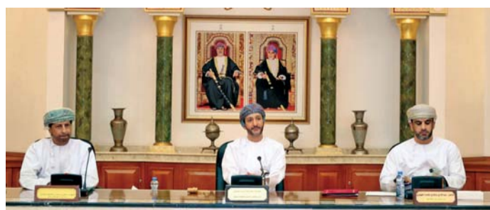
الاجتماع ناقش فاعلية طرق الحماية من الفيضانات

بمنظومة الحماية على أن تعطى الأولوية للمناطق الأكثر ضرراً. وفي سياق الاجتماع، تم استعراض توصيات اللجان الدائمة للمجلس حيث جاء في مقدمتها توصيات لجنة الشؤون الصحية والبيئية بشأن تحديثات نظافة الشواطئ في محافظة مسقط، حيث تم التطرق للحلول المناسبة والإجراءات الفعالة بمشاركة المعنيين من وزارة الثروة الزراعية والسمكية وموارد المياه وبلدية مسقط.