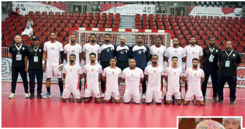
فريق كرة اليد بنادي عمان