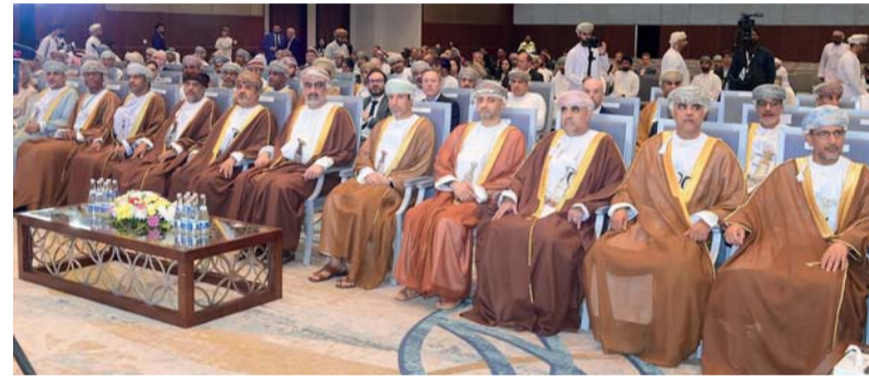
رئيس مجلس محافظي البنك المركزي العماني والحضور خلال افتتاح أسبوع عمان للاستدامة

الوطني نحو تبني مبادرات الاستدامة في سلطنة عمان. رعى حفل الافتتاح صاحب السمو السيد تيمور بن أسعد آل سعيد رئيس مجلس محافظي البنك المركزي العماني، بحضور عدد من أصحاب المعالي وأعمال المعارض العمانية والقطاعين العام والخاص. ويهدف أسبوع عمان للاستدامة الذي تنظمه شركة أعمال المعارض العمانية