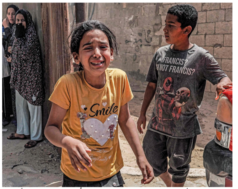
أطفال فلسطينيون أثناء فرارهم من القصف الإسرائيلي على النصيرات في وسط قطاع غزة. (أ.ب.)