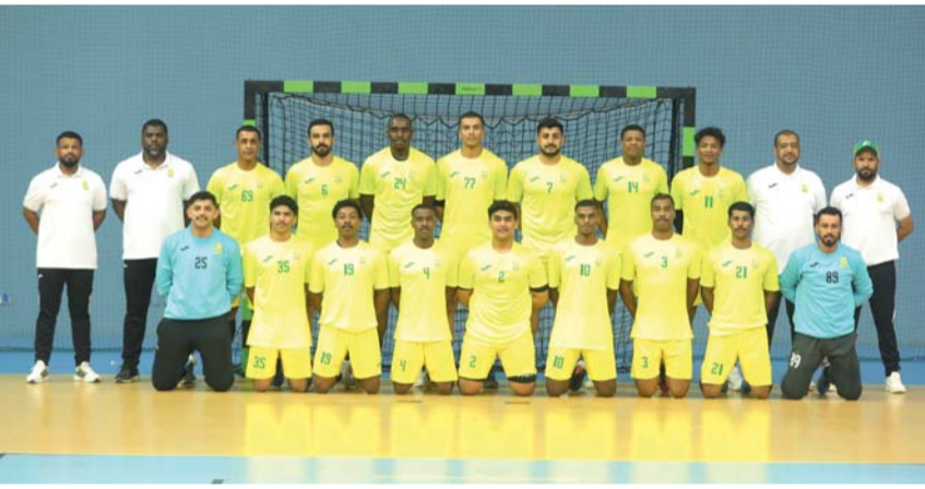
فريق كرة اليد بنادي السيب