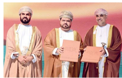
توقيع اتفاقيات ومشاريع إسكانية

وأشار إلى أن السوق العقاري يحتاج إلى توفير بيانات كثيرة للمستثمرين وتحتوي على الشمولية والشفافية والأنية تقوم بها