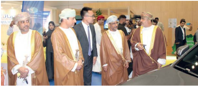
أسبوع عمان للاستدامة يساهم في دفع جهود التنمية والتقدم نحو المستقبل

عرض النتائج والإنجازات التي حققتها أحدث مزاداتنا، مما يعكس التزامنا بتطوير حلول الطاقة المستدامة والمساهمة في نمو القطاع. وأقيم على هامش المؤتمر، معرض أسبوع عمان للاستدامة لهذا العام بمشاركة أكثر من ١٢٠ شركة من ٨ دول، ومن المتوقع أن يستقطب أكثر من ١٢,٠٠٠ مشارك، كما يضم المعرض أكثر من ٧٠ متحدثاً من ١٢ دولة. ويشهد أسبوع عمان للاستدامة إقامة الجلسات الحوارية التي تهدف إلى تبني الاستدامة على جميع المستويات، وتوفير منصة حيوية لتبادل المعرفة والخبرات والتعاون البناء، كما يقام على هامش الأسبوع المؤتمر الدولي لموارد الاستدامة والتكنولوجيا الذي يوفر منصة وطنية رائدة ستجمع أكثر من ٣٠ من قادة الاستدامة وصناع القرار وخبراء الصناعة من مختلف القطاعات، وتسهيل تبادل الخبرات التقنية وإعداد الشركات نحو تحقيق الحياد الصفري الكربوني ومستقبل مستدام. ومن أبرز الفعاليات الرئيسية الأخرى في «أسبوع عمان للاستدامة»، اجتماع الطاولة المستديرة للمديرين التنفيذيين الذي يجمع كبار المسؤولين لأصحاب المصلحة المعرضين في القطاع وصانعي السياسات لوضع استراتيجيات تعاونية تهدف إلى تحقيق الأهداف الوطنية الشاملة وتعزيز الاستدامة على الصعيدين الاقتصادي والاجتماعي.