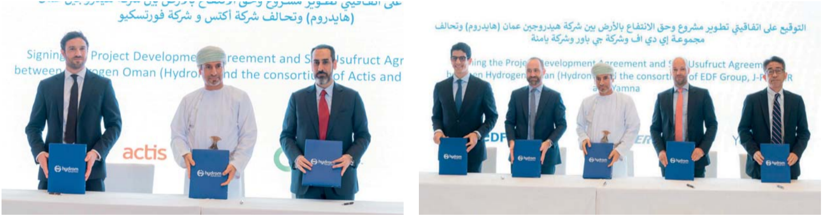
■ اتفاقيات الهيدروجين الجديدة التي تم توقيعها تغطي مساحة إجمالية تبلغ ٦٨٢ كيلومتر مربع

المزايحة العالمية وتوقيع الاتفاقيات في أقل من سنتين، والآن، نحقق إنجازاً جديداً في رحلتنا عبر إسناد مشروعين جديدين إلى شركائنا الجدد. واليوم، وبعد استكمالنا لهذه الجولة، نتقدم سلطنة عُمان بثقة نحو تحقيق أهدافها الطموحة لإنتاج من مليون إلى ١,٥ مليون طن سنوياً من الهيدروجين الأخضر بحلول عام ٢٠٣٠. وتغطي اتفاقيات الهيدروجين الجديدة التي تم توقيعها مساحة إجمالية تبلغ ٦٨٢ كيلومتراً مربعاً حيث يتراوح متوسط سرعة الرياح بين ٦,٨ ميل في الثانية و٨,٣ ميل في الثانية ومستويات الإشعاع الشمسي ٢٤١٠ واط لكل متر مربع، وإلى جانب المشاريع الستة التي أسندت في العام الماضي، تكون هايدروم قد نجحت في بلوغ أهداف الإنتاج المرسومة في الاستراتيجية الوطنية لعام ٢٠٣٠ مما يعزز من إمكانات البلاد بين الدول المنتجة للهيدروجين منخفض الكربون.