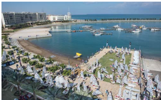
مدرسة المصنعة للإبحار الشراعي