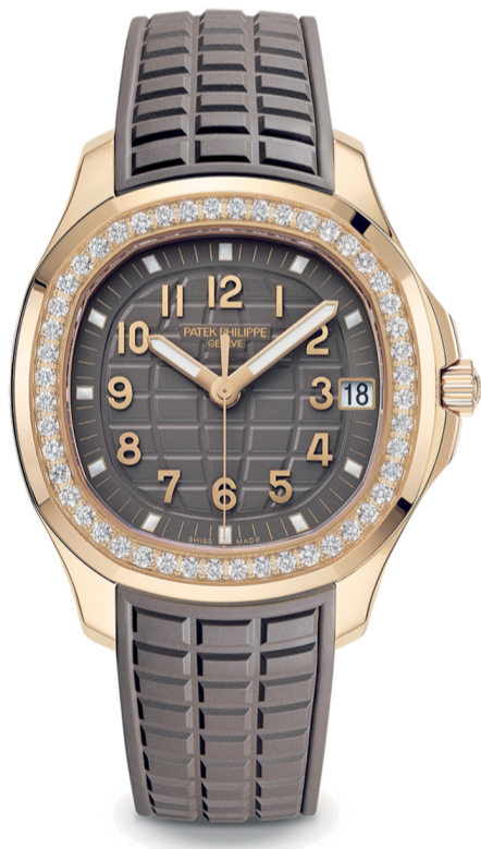
5268/200R LUCE AQUANAUT كود رقم

بل هي أمانة في يدك تنقلها بعناية إلى الأجيال القادمة.. إلى أقرب الأحباء.. الأقارب.