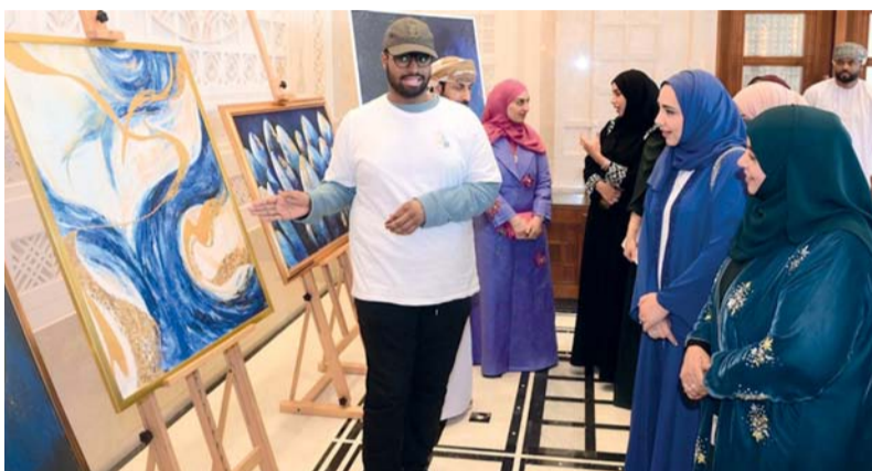
اللوحات جسدت ثقافة وتقاليد المجتمع العماني

اضطراب طيف من خلال الدمج والتمكين، وفيما لوحة (الأمل) التي تعبّر عن انبعاث الأمل في حياة حالات اضطراب طيف التوحد بعد التأهيل. وشهد الحفل تدشين صاحبة السمو السيدة قصة (نوح)، وهي نتاج جهود فريق عمل متخصص بالمركز الوطني للتوحد، وصُممت بعناية لتلبيّ حاجات وتطلعات هذه الفئة المهمة في المجتمع، وتهدف إلى توفير مصدر توعية وتثقيف عن اضطراب طيف وتعد قصة (نوح) أول قصة ضمن سلسلة قصصية مقتبسة من واقع حياة الأشخاص المصابين باضطراب طيف التوحد، بدعم من الشركة العمانية للاتصالات عمانتل.