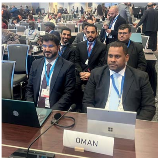
الوفد المشارك في أعمال الدورة

شاركت سلطنة عمان في أعمال الدورة الرابعة للجنة التفاوض الحكومية الدولية لإعداد صك دولي ملزم قانوناً بشأن إنهاء التلوث بالمواد البلاستيكية، بما في ذلك البيئة البحرية، والذي أقيم في العاصمة الكندية أوتاوا، ضم الوفد المشارك ممثلين من هيئة البيئة ووزارة الاقتصاد ووزارة الطاقة والمعادن ووزارة التجارة والصناعة وترويج الاستثمار. وقدمت دول مجلس التعاون الخليجي . ممثلة بدولة قطر التي ترأس دورة المجلس . البيان الافتتاحي حيث أكدت فيها عن العزم والتعاون مع كافة ممثلي الدول لإنجاح دورة التفاوض وتحقيق أهدافه والالتزام بما نص عليه قرار جمعية الأمم المتحدة للبيئة رقم «١٤/٥» مع الأخذ بعين الاعتبار عدم