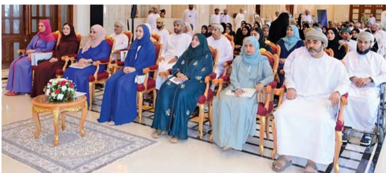
الحضور أثناء افتتاح المعرض

في المجتمع، كما الصوف لاستهداف الجوانب الحسية لحالات اضطراب طيف التوحد، وإلهام مراكز التأهيل وتصنع بخيوط بدرجات مختلفة من الإمكانات ومهارات الإبداع لدى كافة الفئات العمرية الموجودة قدراهم الفنية عبر صقل وتنمية مهاراتهم ودمج الفن في مختلف برامجهم وأنشطتهم، وتوفير بيئة داعمة ومحفزة تساعدهم على الاندماج في المجتمع وتحقيق إمكاناتهم الكاملة. وضمّ المعرض لوحات فنية معبرة جسّد بعضها الزي العماني التقليدي، وثقافة وتقاليد المجتمع العماني، ولوحة أخرى بعنوان (حصاد) تعبّر عن رحلة الحصاد وجني الثمار، فيما عكست لوحة عمق التباين في عالم اضطراب طيف التوحد