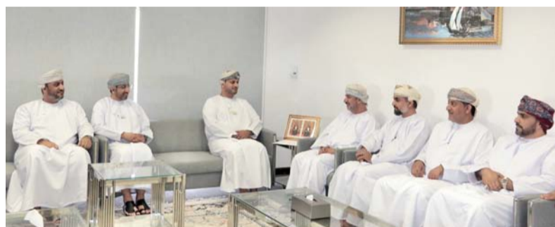
الاجتماع ناقش موضوعات تعزيز حقوق الإنسان

زار سعادة نصر بن خميس الصواعي المدعي العام مقر اللجنة العمانية لحقوق الإنسان، حيث التقى بالاستاذ الدكتور راشد بن حمد البلوشي رئيس اللجنة، وعدد من أعضائها، وأمين أمانتها الفنية، بحضور ممثلين عن الادعاء العام، تم خلال اللقاء مناقشة عدد من الموضوعات ذات الاهتمام المشترك، وبحث تعزيز التعاون والتنسيق بين اللجنة العمانية لحقوق الإنسان، والادعاء العام في المجالات المتعلقة بحقوق الإنسان بما يكفل حماية وتعزيز حقوق