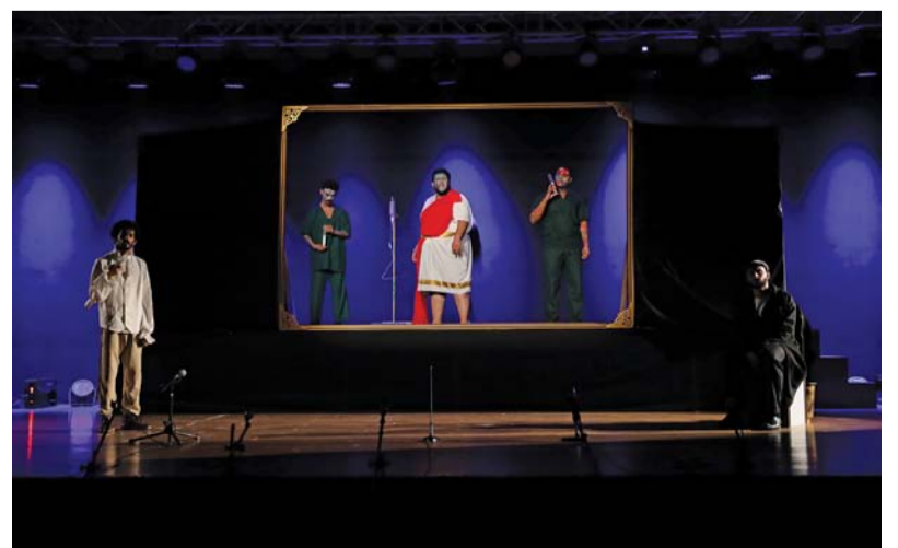
مشهد من أحد العروض المسرحية