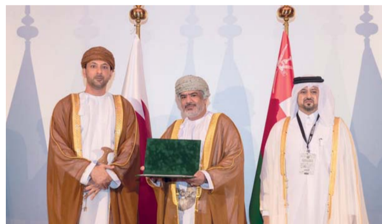
التكريم بحضور المسؤولين عن الآثار والمتاحف بدول مجلس التعاون الخليجي

وبعض غرف الخدمات. يبلغ طول البيت ٤٠ متراً وعرضه ٣٠ متراً وهو الجزء الذي تم ترميمه ومجموع الغرف بداخله حوالي ١٥ غرفة وقد روعي في ترميمه استخدام نفس المواد التقليدية القديمة المستخدمة سابقاً وهي: الطين، الصاروج العماني، الجص العماني، الحجارة الجبلية المسطحة، وقد أعيد تسقيفه بنفس الألية السابقة، حيث استخدمت أخشاب الكندل والدون واليامبو، وقد روعي في أعمال الترميم أسلوب المحافظة على بعض النقوش الجصية الموجودة سابقاً بالإضافة إلى ترميم الأبواب القديمة وبالأخص الباب الرئيسي، كما تم إدخال نظام التكييف والكهرباء مع مراعاة الخصوصية في أثرية البيت.