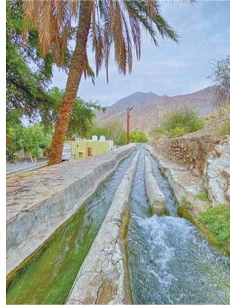
أخذ الأفلاج التي تم صيانتها

وتم صيانة فلج واحد في محافظة مسندم وآخر في شمال الباطنة، وه أفلاج في جنوب الباطنة، و٤ أفلاج في شمال الشرقية، وثلاثة آخرين في جنوب الشرقية، و٧ أفلاج في الظاهرة، بالإضافة إلى صيانة ١٧ عينًا مائيًا في محافظة ظفار بمجموع ٣٨ فلجًا وعينًا مائيًا.