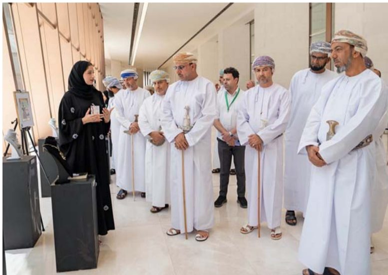
الطلبة المشاركون يقدمون نبذة فنية للحضور

مرتباً واللامسوم مسموعاً، وتجعل الفكر محسوساً والمضمون والشكل متجانسان متناغمان ضمن أثر فني حي قابل للتأويل، وقد صاحب كل ركن ولوحاته المشاركة شرح مفصل عن طبيعتها الفنية وفكرتها وأسلوبها الإبداعي وقد تبني فيها الطلبة تطبيق الأساليب والمدارس الفنية التي درسوها كرسوم الطبيعة الصامتة، والرسم التصويري، ونحت الأشغال الخشبية والفنية، وتصميم الخزف والحلي والمجوهرات، وتصميم الأزياء. الجدير بالذكر أن معرض (الفن يعبر الزمان: رؤى وتأملات طلبة جامعة نزوى)، يأتي تزامناً مع اقتراب اليوم الوطني للمتاحف.