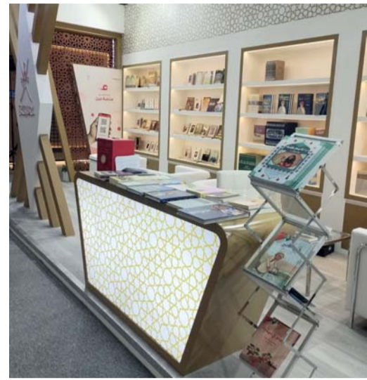
جناح سلطنة عمان يحوي قائمة موسعة من عناوين الكتب والإصدارات

برنامج ثقافي تعليمي وحفلات توقيع إصدارات الكتب. يذكر أن عدداً من دور النشر العمانية تشارك في المعرض كمكتبة الضامري ومركز حدائق الفكر ودار نثر والقرية الهندسية إلى جانب وزارة الثقافة والرياضة والشباب.