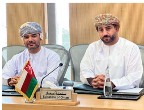
أثناء مشاركة وفد سلطنة عُمان في الاجتماع

تأثير ضيق الوقت على جودة الصك والذي ينبغي صياغته على توافق الآراء من خلال الحوار النشط وفهم وجهات النظر المختلفة لإيجاد أرضية مشتركة على أن يتم إظهار المرونة والموازنة لاحتياجات وقدرات الدول.