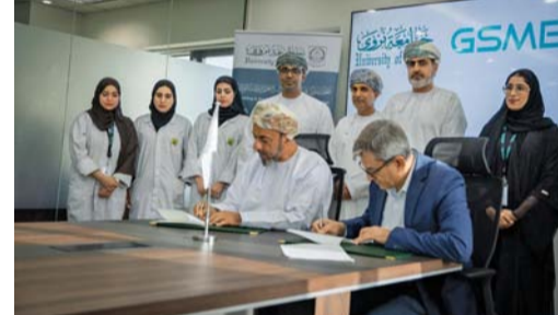
أثناء توقيع مذكرة التفاهم