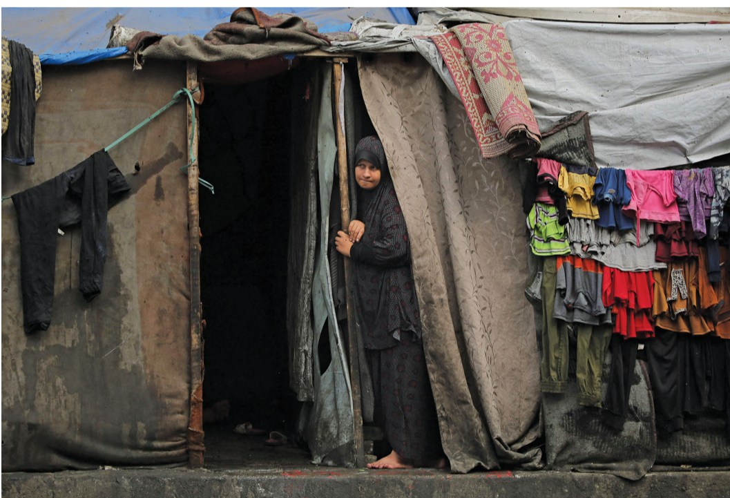
فلسطينية تقف عند مدخل خيمة في منطقة تؤوي النازحين برفح جنوب قطاع غزة.

واصلت الطائرات الحربية لإحتلال الإسرائيلي قصفها العنيف لمختلف مناطق قطاع غزة خلفه العشرات من الشهداء والجرحى، حيث يستمر الإحتلال في ارتكاب المجازر مع تزايد تهديداته باجتياح رفح. وقال رئيس الوزراء الإسرائيلي بنيامين نتانياهو إنه لا تغيير في أهداف الحرب، وإن حكومته لن تقبل بتسوية بخصوص رفح، مشيراً إلى أن احتمال التوصل إلى صفقة تبادل ضئيل، ولن تقبل إسرائيل، بالانسحاب المطلق من قطاع غزة. من جانبها أدت حركة «فتح» و«حماس» ضرورة الوحدة الوطنية وإنهاء الانقسام، وذلك في إطار